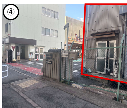
④入って右側の受付までお越しください。