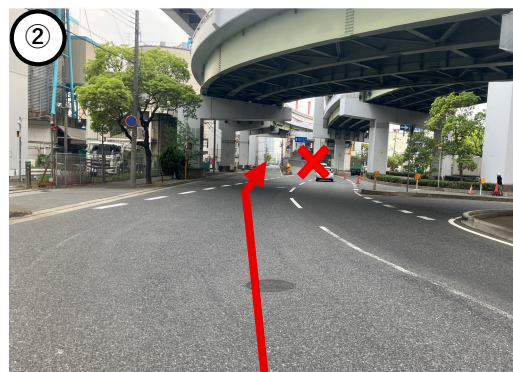
②坂を上げらず、 左の側道 へ進んでください。