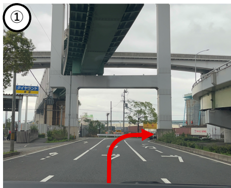
①中央の車線を走行してください。